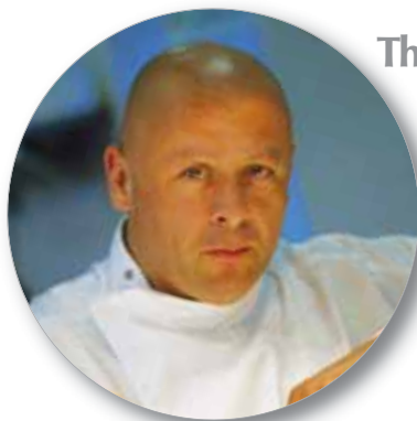
Thierry Marx** Hôtel Restaurant le Mandarin Oriental Cuisinier français, adepte de la cuisine moléculaire